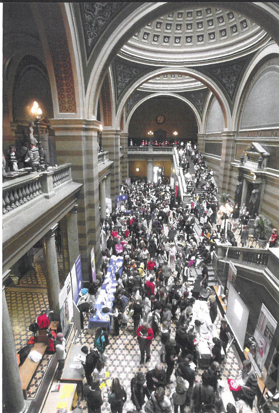
Mottagning av nya studenter i Universitetshuset. Internationella rankingslistor har på kort tid kommit att få stor påverkan på universitet – även för rekrytering av studenter. Numera rankas även rankingar.

fram en serie kriterier, baserade på öppna och lätt tillgängliga data (Nobelpris, publikationer i Science och Nature , highly cited researchers etcetera). Viktigt för att en sådan lista skall få legitimitet är förstås att den bekräftar gängse och spridda uppfattningar. Följdriktigt hamnade Harvarduniversitetet i topp och fick index 100.